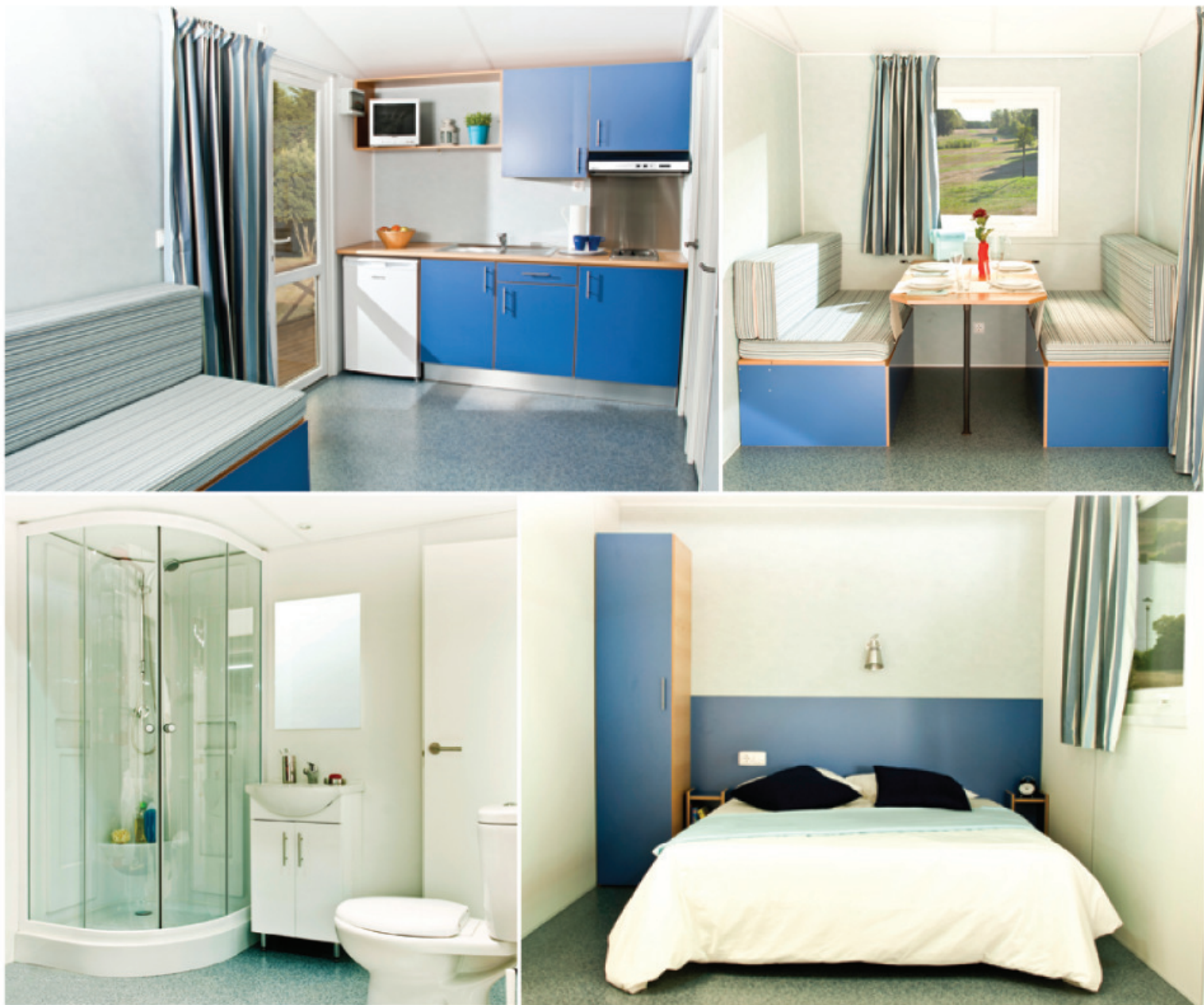
Sugestão de apresentação