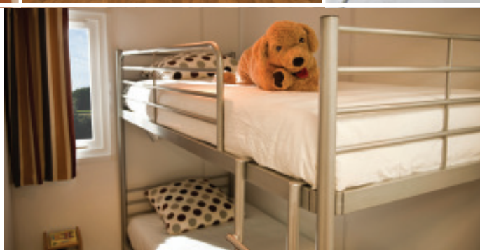
Sugestão de apresentação