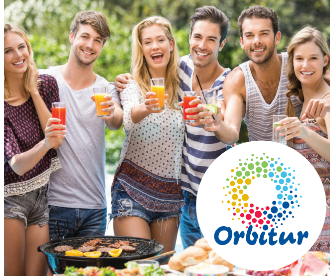
Tabela de Preços Price List (a) 2020